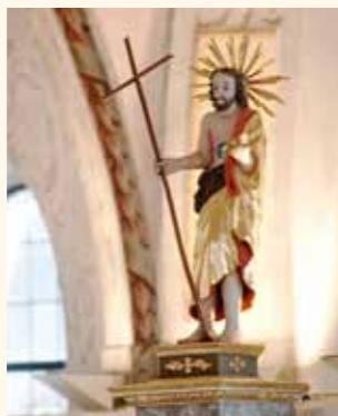
Johannes der Täufer

H erzlich Willkommen in unserer Pfarrkirche! In ihrer barocken Pracht steht sie seit 1756. Im Jahr 2001 erfolgte die komplette Innenrenovierung. Fresken und Altäre wurden restauriert.