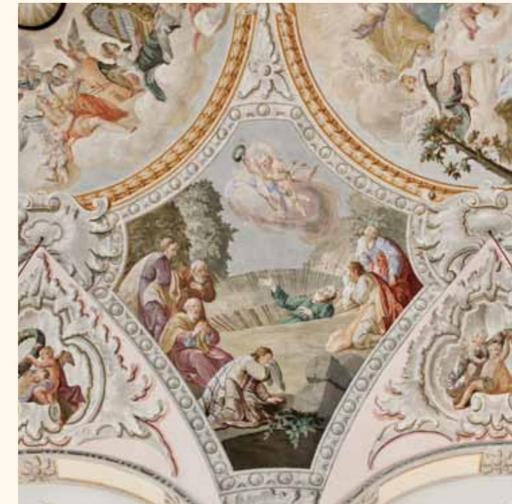
Das Selbstbegräbnis des Johannes

E ine seltene Darstellung nach der »Goldenen Legende«: der Apostel Johannes erfuhr von Christus den Zeitpunkt seines Todes – als Einladung zum himmlischen Gastmahl. Am betreffenden Sonntag ließ Johannes nach der Sonntagspredigt ein Grab ausheben, legte sich hinein, betete und wurde von einem wunderbaren Lichterglanz verherrlicht.